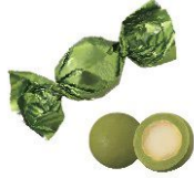
Uji Matcha 宇治抹茶