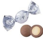
Sea Salt シーソルト