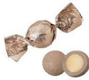
Caffè Latte カフェラテ