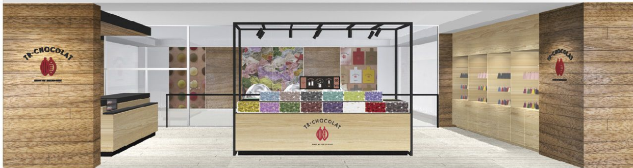
*TR-CHOCOLA ショップイメージ